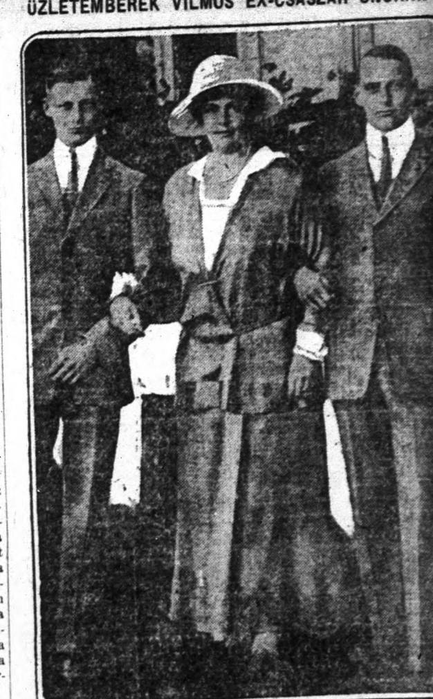
A háború előtt Vilmos és Frigyes Vilmos porosz királyi hercegek... ÜZLETEMBEREK VILMOS EX-CSÁZAR UNOKAI.

ERDEKES PER A FÓTORVÉNYSZEKEN... MI LETT A WAGRAMI HERCEG LEÁNYJÁBÓL?