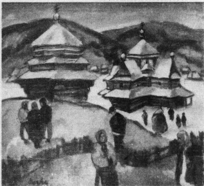
Koczka András: Körösmezői vásárnap (Olajfestmény) L. beszámolóinkat az ungvári irodalmi és művészeti napokról