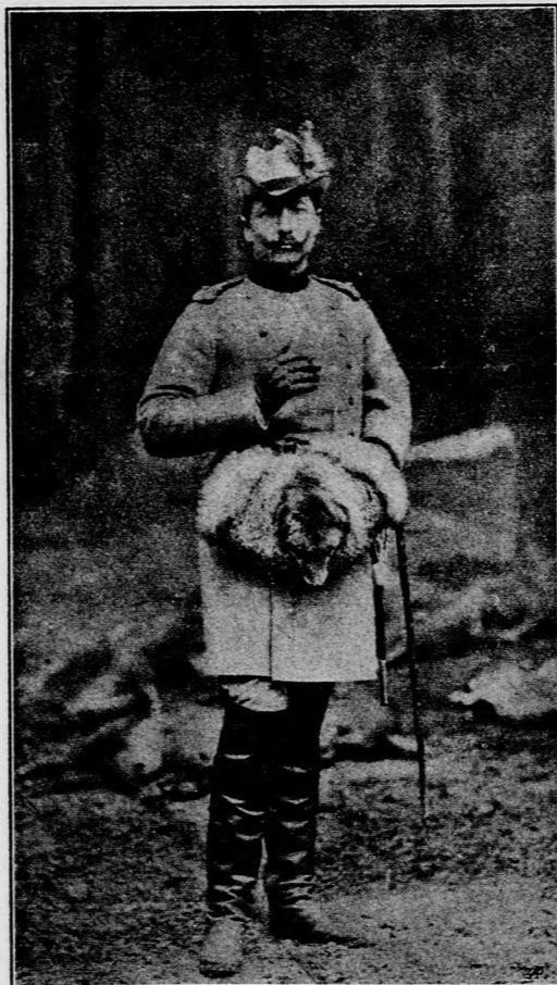
Vilmos német császár.

És amíg indokolatlan az önelégültség, épp oly jogosult lesz a megvető tekintete.