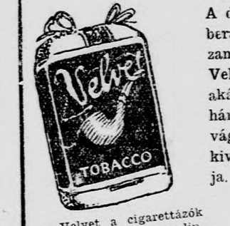
Velvet a cigarettázok kedvelmére maszlin-zacsokban, 5 cent.