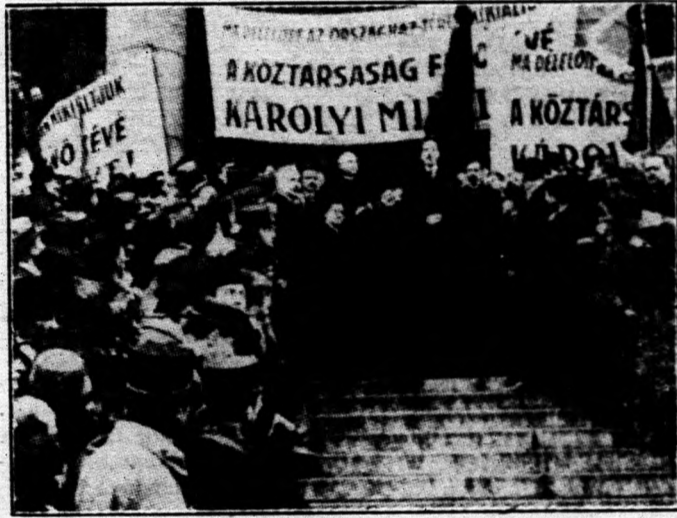
Károlyi Mihályt a magyar köztársaság elnökének kiáltják ki.

Aggódva tekint az amerikai magyarság a jövő felé. Magyarország sorsáért aggódnak azok is, akiket sokezer mértföld választ el a szülőhazától, akik sok összekötő kapcsot bontottak szét, de nem szakíthatták el azokat a fonalakat, melyek a szívet kötik össze a szülőfölddel. A mai Magyarország népe és kormánya tisztában van a helyzettel. Magyarország népe csodálatos türelemmel hordja a keresztet, bámulatos józansággal, tisztelet-