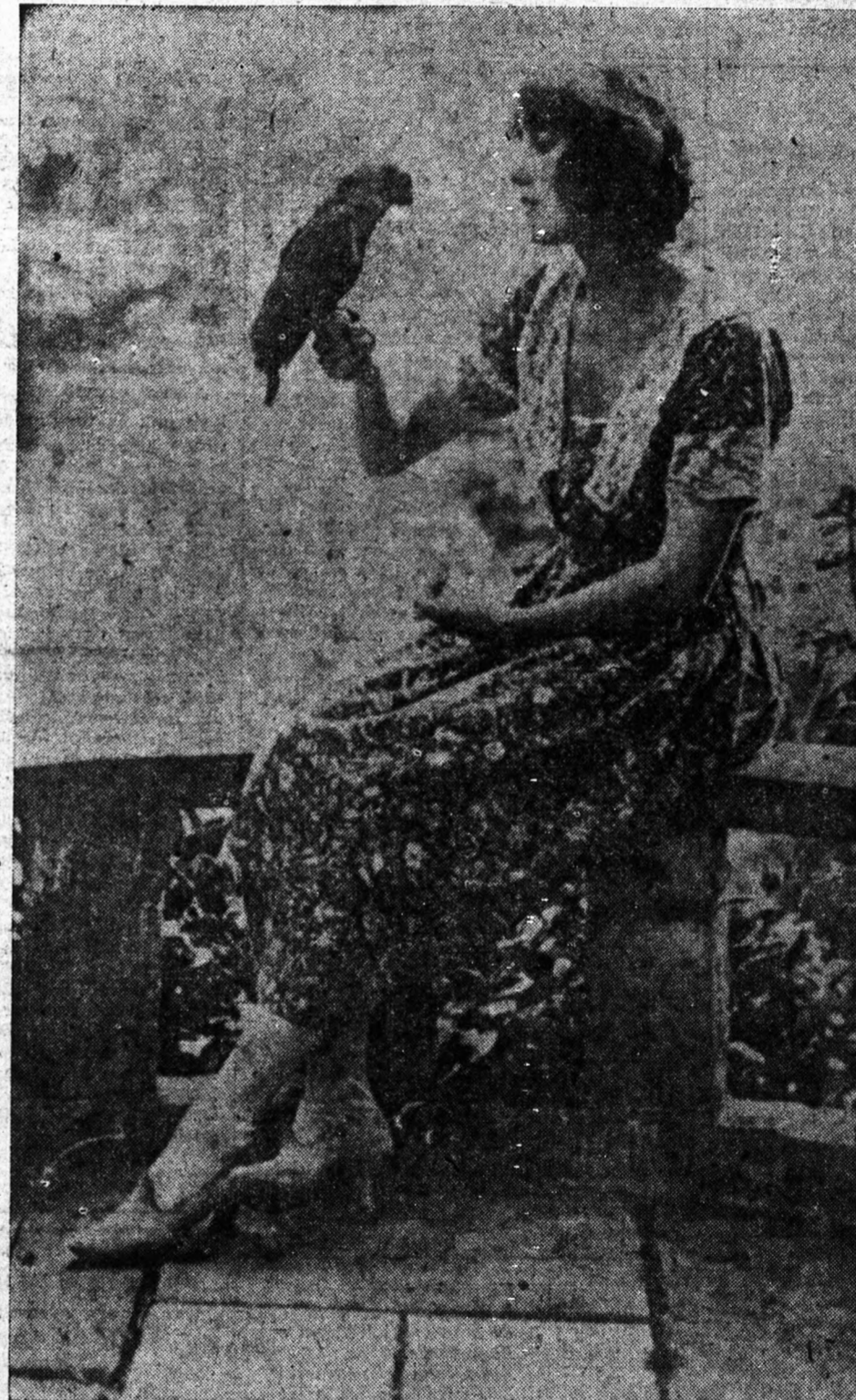
"Volt egyszer egy fehér galamb, ragyogott a tollazata, csókos csörét szép királylány ölelgette, csókolgatta..." — Van még valaki, aki emlékszik a "Bob hercegre"? Mintha ennek a régi bájos operettnak a hangulata elevenednék meg előttünk egy pillanatra. Ki tudja mikor röppen fel a mesebeli madár a szép leány kezéből, hogy elszálljon messze, messze tájra.