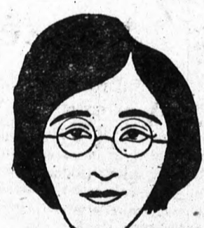
Az erős vízszintes vonalakkal ellátott üveg kiünteti az arc szabálytalanságát, mert az arc felső részét sokkal szélesebbnek mutatja.