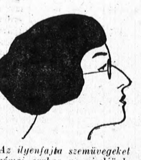
Az ilyenfajta szemüvegeket római orrhoz ne viseljenek, mert kidomborítja az orr görbületét s ezzel sokat árt az orr egész formájának.