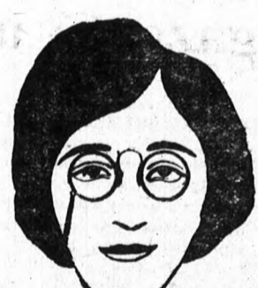
Ha az arc a szemöldökénél szélesebb mint az állnál, hosszú rugó, sötét keretes fekete szalag igen előnyösen emeli az arc harmoniáját.