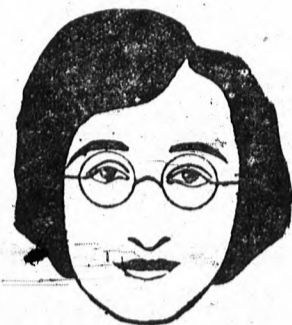
A közönséges pápaszemeknek a hídja rövidíti az orrot. Ha az orr római jellegű lútságosan kidomborodik, orrcsípétét viseljenek.

Egy chicagói szemszakértő érdekes fejtegetései arról, hogy a különböző mintájú és kidolgozású szemüvegek milyen típusokra alkalmazhatók, olyképen, hogy ezeknek a szépségét növeljék, ahelyett, hogy azt csökkentenék. — Milyen formákat ad a szemüveg az arcnak?