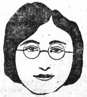
Az orrnál csaknem egyenes nyeregugróval és egyenes orrcsípítővel ellátott szemüvegek a ténylegesnél szélesebbnek mutatják az arcot.

A SZEMÜVEG növelni tudja az arc szépségét, avagy csökkenteni azt, aszerint, hogy miféle szemüvegminőt miféle arera alkalmaznak. Az egész optikai csalódás csupán. Ezt nagyon jól tudjuk, azonban az illúzió mégis tökéletes, mert a szemünk nem alkalmazkodik az agyunk érvéleséhez és a szemideg úgy adja vissza a látottakat, ahogyan azt az illúzió ködében látja. Így ha kerek, pufók, árcson olyan szemüveget látunk, amely vastag, békateknős orrhíddal van ellátva s hozzá még egyenes fülérősítővel is, az illető arcot még kövérebbnek látjuk, ha pedig egyenes vonalú orrhíddal ellátott szemüveget látunk hosszú orron, az orrot még hosszabbnak fogjuk látni. Egy chicagói szemorvosnak annyira feltűnt, hogy egyes betegeit mennyire elcsúfítja bizonyos fajta szemüveg, míg más betegeit ugyanaz a fajta szemüveg megszépíti, hogy tudományos buvárkodás tárgyává tette a kérdést. Buvárkodásának az eredményét most tette közzé megfelelő ábrákkal, amelyek mutatják, hogy a különböző alakú szemüvegek miféle hatást gyakorolnak a különböző típusokra. Az üveg ebből a szempontból teljesen mellékes. A fontos a keret, mert ez adja meg a külső hatást az arera, az egyes típusoknál, az ábrák egy részét mellékeltem be is mutatjuk.