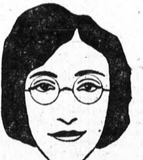
Hosszú, keskeny, archez világos keretű, vagy teljesen keret nélküli szemüveget viseljenek; a lehető legvízszintesebb vonalakkal.

piúsaiból. Ezeknek mindenki hasznát veheti a szemüvegvásárlás alkalmával. A pápaszem mindig öregebbnek mutatja a viselőjét, mint a evikker, vagyis orrcsípítő. Ennek az oka, mint már említettük, a fülérősítő hatásában keresendő. A tudományos oka az, hogy a fülérősítő irányja mindig egyenlő a szemráncával, amely az öregebbnek egyik kifejező jele. Az ovális alaku keretek szélesítik az arcot, még pedig azért, mert a felső és az alsó görbületek, melyek a vízszintest közelítik meg, nagyobbak, mint az oldalgörbületek, amelyek a függőlegest közelítik meg. Magas emberek alacsonyan hordják a szemüvegeiket, mert hiszen rendszerint lefelé néznek az embertársaikra, míg a gyerekek és az alacsonytermetű emberek magasan kellene, hogy hordják, a fordított oknál fogva. A sötét keretes szemüvegek kisebbnek mutatják az arcot a kelletnél. Ha a szemöldököket és a szemhéj szőrzetét levennénk, akkor az arcunk hosszabbnak tűnnék fel, mert mindketten vízszintes irányban hatnak és így szélesítik az arcot. Két egyforma méretű arc között, ha az egyik szőke, a másik barnás, az utóbbi rövidebbnek és szélesebbnek fog látszani, kivéve, ha a szőkeknél sötétebb szemöldökei és szemhéj szőrei vannak. Igen világos haju nőknek nem nagyon fontos a szemüveg alakja, mert maga a világos hajuk és komplexumuk az arc karakterisztikumát eltünteti.