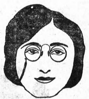
A kerekarcuak ilyenfajta szemüvegeket használnak, melyek fekete szalaggal ami az arcot sokkaltá hosszabbnak mutatja, mint anélkül.

piúsaiból. Ezeknek mindenki hasznát veheti a szemüvegvásárlás alkalmával. A pápaszem mindig öregebbnek mutatja a viselőjét, mint a evikker, vagyis orrcsípítő. Ennek az oka, mint már említettük, a fülérősítő hatásában keresendő. A tudományos oka az, hogy a fülérősítő irányja mindig egyenlő a szemráncával, amely az öregebbnek egyik kifejező jele. Az ovális alaku keretek szélesítik az arcot, még pedig azért, mert a felső és az alsó görbületek, melyek a vízszintest közelítik meg, nagyobbak, mint az oldalgörbületek, amelyek a függőlegest közelítik meg. Magas emberek alacsonyan hordják a szemüvegeiket, mert hiszen rendszerint lefelé néznek az embertársaikra, míg a gyerekek és az alacsonytermetű emberek magasan kellene, hogy hordják, a fordított oknál fogva. A sötét keretes szemüvegek kisebbnek mutatják az arcot a kelletnél. Ha a szemöldököket és a szemhéj szőrzetét levennénk, akkor az arcunk hosszabbnak tűnnék fel, mert mindketten vízszintes irányban hatnak és így szélesítik az arcot. Két egyforma méretű arc között, ha az egyik szőke, a másik barnás, az utóbbi rövidebbnek és szélesebbnek fog látszani, kivéve, ha a szőkeknél sötétebb szemöldökei és szemhéj szőrei vannak. Igen világos haju nőknek nem nagyon fontos a szemüveg alakja, mert maga a világos hajuk és komplexumuk az arc karakterisztikumát eltünteti.