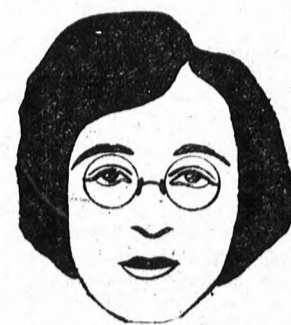
Ha alacsony és kiemelkedő hídát viselünk, az orr jóval rövidebbnek látszik a ténylegesnél. — Ilyeneket hosszú orruak viseljenek.