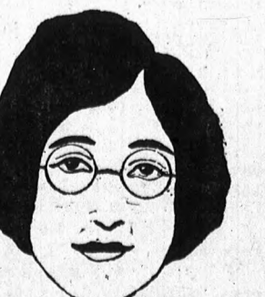
Olyan archez, mely az állnál szélesebb, mint a szemöldökénél, alacsony orrnyeregű és vízszintes fülérősítővel ellátott pápaszem áll jól.

nak, a vízszintes sávok alacsonyabbnak mutatják. Ugyanez alkalmazható az arera is. Valami tárgyon keresztül vont egyenes vonal ezt a tárgyat a vonal irányában mindig hosszabbnak mutatja. Ez az oka annak, hogy az egyenes vonalú fülérősítővel ellátott szemüvegek az arcot általában szélesebbnek mutatják. A világos kerettel ellátott, avagy keret nélküli szemüvegek szintén szélesnek mutatják az arcot, míg a sötét keretűek keskenyebbnak. Az arc tulajdonságai, amelyek a karakterisztikumát megadják, a szélesség, avagy a keskenység és az orrnak az arányai, tehát akkor, amikor szemüveget választunk, elsősorban ezekre kell tekintettel lennünk. Még a keretnek az árnyéka is sokkaltá nagyobb hatással van az arakifejezésre, mint azt gondolni lehetne és ez az egyik hátránya a nagyon nagy teknős-béka szemüvegrámkáknak. Ime néhány szemelvény a szakértő megállapításai alapján.