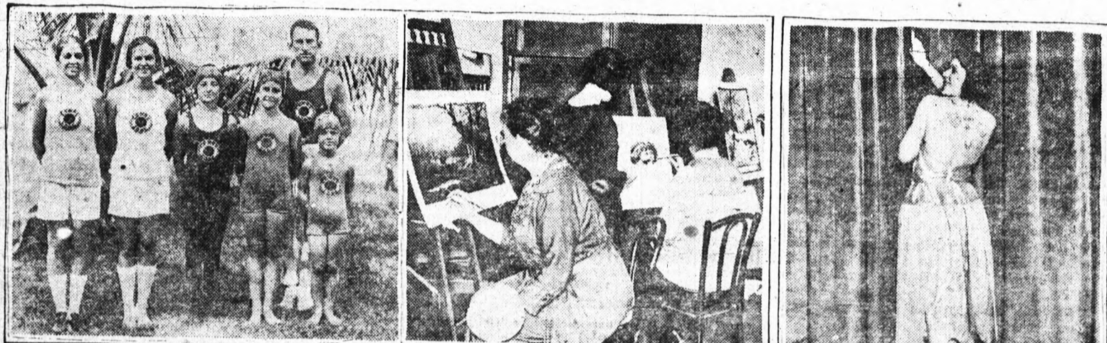
A világ leghíresebb gyermek atlétái. A gyermekek a Panama csatorna mentén voltak és az atletika összes ágában nemcsak, hogy jártasak, de olyan eredményeket értek el, a minőket a legkiválóbb felnőtt atléták is nagyon nehezen tudnak utánozni.