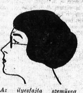
Az ilyenfajta szemüveg rendszeren előnyösen mutatja a hegyes orral ellátott arcokat, noha a hegyességet a kelletnél jobban mutatja.

nak, a vízszintes sávok alacsonyabbnak mutatják. Ugyanez alkalmazható az arera is. Valami tárgyon keresztül vont egyenes vonal ezt a tárgyat a vonal irányában mindig hosszabbnak mutatja. Ez az oka annak, hogy az egyenes vonalú fülérősítővel ellátott szemüvegek az arcot általában szélesebbnek mutatják. A világos kerettel ellátott, avagy keret nélküli szemüvegek szintén szélesnek mutatják az arcot, míg a sötét keretűek keskenyebbnak. Az arc tulajdonságai, amelyek a karakterisztikumát megadják, a szélesség, avagy a keskenység és az orrnak az arányai, tehát akkor, amikor szemüveget választunk, elsősorban ezekre kell tekintettel lennünk. Még a keretnek az árnyéka is sokkaltá nagyobb hatással van az arakifejezésre, mint azt gondolni lehetne és ez az egyik hátránya a nagyon nagy teknős-béka szemüvegrámkáknak. Ime néhány szemelvény a szakértő megállapításai alapján.