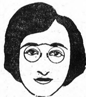
A magas nyeregugró hosszabbítja az orrot, mert a néző szemé önkénytelenül is egészen a nyereg magasságáig követi az orr vonalát.