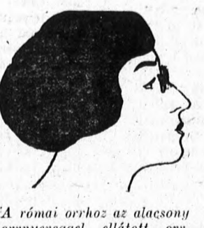
A római orrhoz az alacsony orrnyeregű ellátott orrcsípítő illik, amely a rugók nyomása folytán előrehozza a bőrt a nyereg felett.