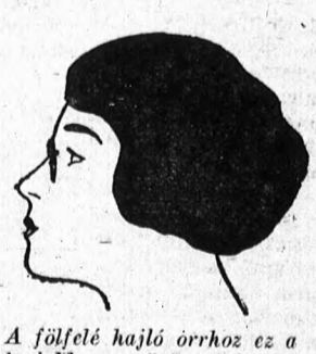
A fölfelé hajló orrhoz ez a legjobb szemüveg fajta, amelynek a formája nem domborítja ki az orr hegyének fölfelé való hajlását.