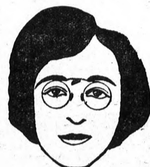
A tetőről kiinduló magas nyeregugró hosszítja az orrot úgy, hogy a ténylegesnél hosszabbnak látszik. — Ilyeneket piszék viseljenek.