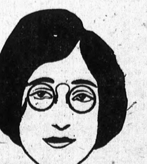
A vízszintes vonalakkal hárnyá és a függőleges szalag még a ténylegesnél is sokkaltá vastagabbnak tűntetik fel a kissé erős állat.

A világos keretű szemüvegek eltompítják a szemöldökök hatását és ilyképen az arcot általában nagyobbbnak mutatják, különösen azonban hosszúságban. A hosszú keskeny archez is viselhetünk világos keretű szemüveget, ha azon erősen vízszintes orrhíd van, mert ez rövidíti és szélesíti az arcot. Az általános szabály azonban rendszeren az, hogy a nagy archez sötét szemüveget, míg a kicsi archez világos szemüvegeket viseljenek, amelyeken alacsony és sötét az orrnyereg, viszont a rövid orruak olyant, amelyeknek magas és lehetőleg világos orrnyerge van. Azok, akiknek kifejezetten rut az arcuk igen sötét keretű szemüveget viseljenek, ez az általános szabály.