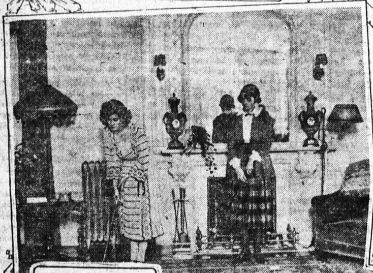
Itt a legújabb — a szobagolf. Eddig igazán mindenki joggal azt hihette, hogy ez lehetetlen. De ime, a divat még a lehetetlent is legyőzi.