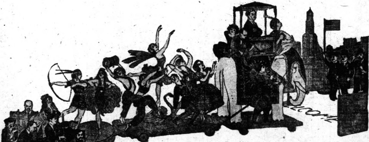
Az invázió rövid története. — A kezdet sikertelenségei és végül a halatlanul nagy sikerek. — Ma már zenitjén áll az orosz művészet szerep-e Amerikában.