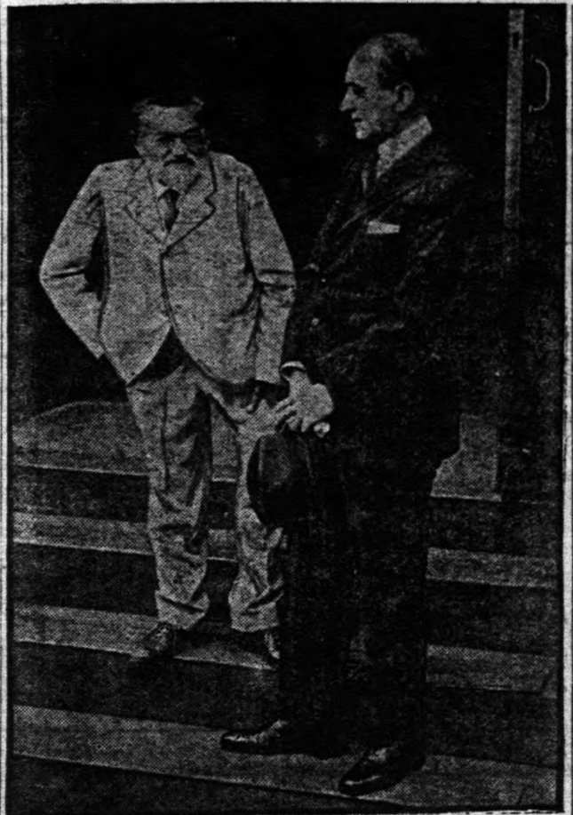
Dr. Charles P. Steinmetz és Guglielmo Marconi.

Bemutatom kis olvasóim, a világ két kiváló feltalálóját: Dr. Steinmetzet, a Schematadyben (N. Y.) élő világhírű gépészmérnököt és Guglielmo Marconit, a nagy értékű, praktikus villany-szerelési és egyéb találmánnyal gazdagított a világot. Marconit jobban ismeri a világ, mint a szikratáviró feltalálóját, aki a levegő villanyosságát fogta az emberi haladás szolgálatába.