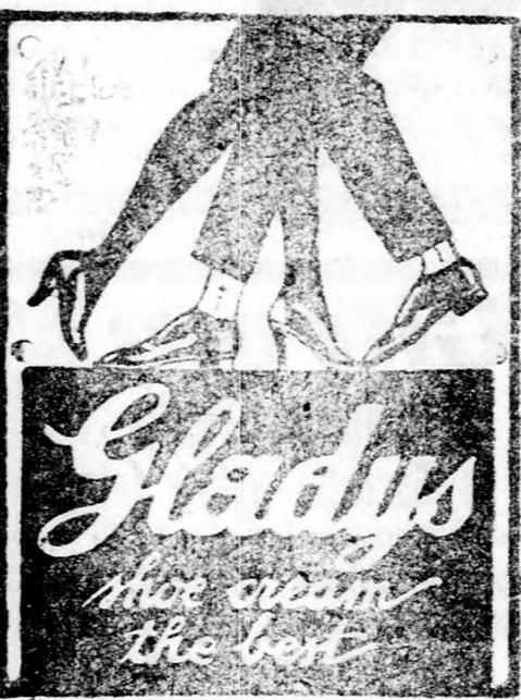
Az előkelő világ cipőkréme

Zsák HAVAS DEZSO Timisoara Zsineg Ponyva 1374