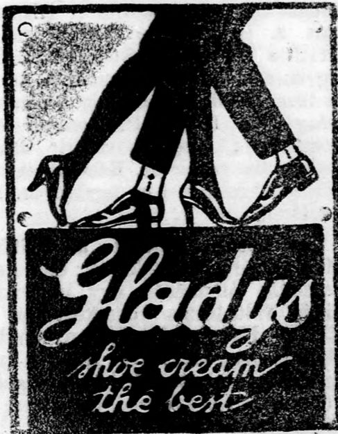
Az előkelő világ cipőkrémje

Felülsségre vonják a bolgár háborus kormányokat. Szófaból jelentik: A kormány törvényjavaslatot készít azon felelős kormányok és politikusok ellen, akik Bulgáriát belekergették a háboruba. A bűnösség kérdésében népszavazás dönt. A törvényjavaslatot a minisztertanács elfogadta és a király is hozzászórt. Ezen az alapon a kormány elrendelte Danev és Marinov-kormányok tagjainak letartóztatását.