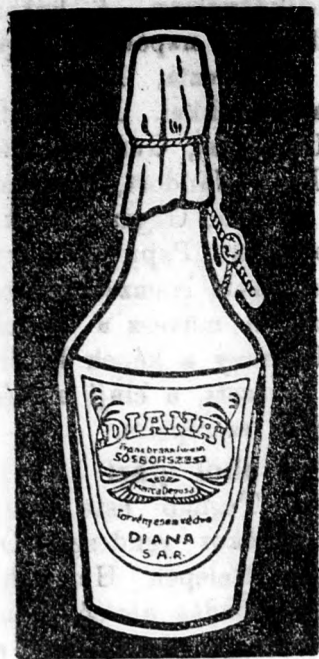
„DIANA“ sósorszesz az egyedüli megbízható háziszor