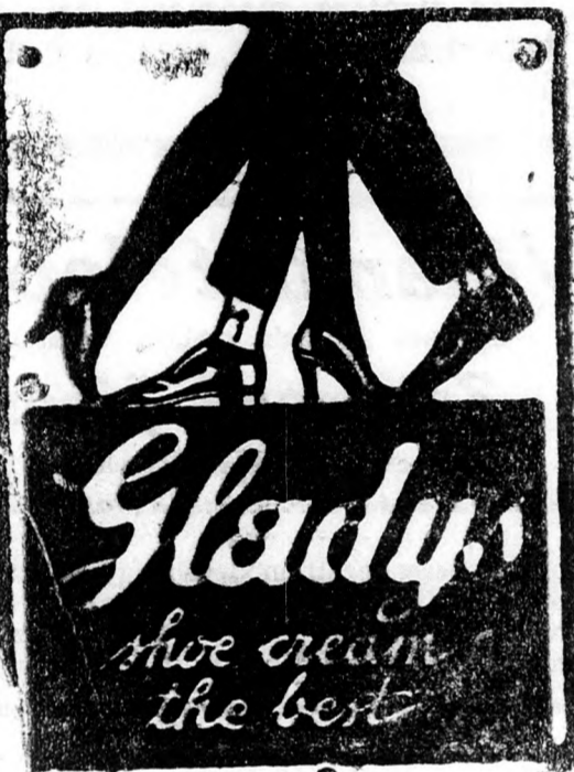
Az előkelő világ cipőkrémje!