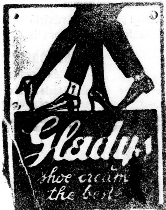
Az előkelő világ cipőkrémje!