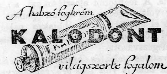
A használati fogkrém

A Kalodont fogkrém minden-napi használata a legbiztosabb módja, hogy fogaink épségét és szépségét megőrizzük.