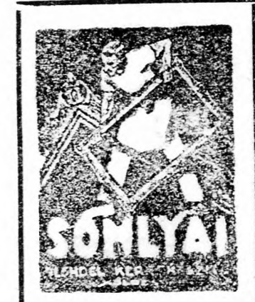
Str. Juliu Maniu 7.

Órákénti könyvelést vál- lal akár délelőttre, akár délutánra mérlegképes könyvelő, magyar német levelez. Szíves megke- reséseket „Önálló” jelűen továbbít a kiadóhivatal. 174