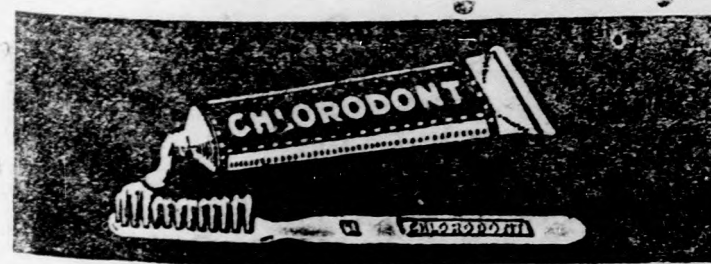
Chlorodont fogpaszta, Chlorodont fogpor, Chlorodont szájvizekivonat

A Ruter-ügynökség jelentése szerint az angol kormány tudomására jutott, hogy Tangerben agitációt folytatnak az ottani angolok és az angol érdekek ellen. Az angol kormány az az álláspontja, hogy jogait és érdekeit minden körülmények között meg fogja védeni Tangerben.