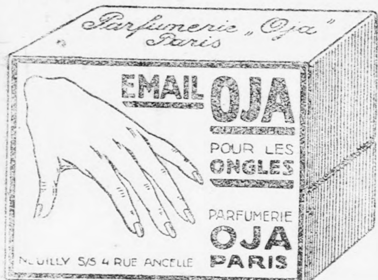
Valódi Email OJA csakis eredeti dobozban kapható

— Ellenőrzik a pénzüzetek zálogüzételt. Bukarestből jelentik: A pénzügyminiszter tudomást szerzett arról, hogy egyes pénzüzetek zálogkölcsonöket folyósítanak anélkül, hogy a 100 leinkénti 30 bani zálogbélyeg illetéket lerónák. A miniszter körrendeletben utasította az összes pénzügigazgatóságokat, hogy a legszigorubbán ellenőrizzék a pénzüzetek zálogüzeteit és amennyiben ezek a bélyegilletékeket nem rónak le, lelelezzék meg őket.