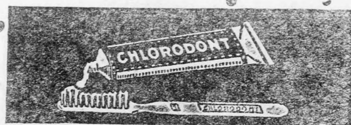
Chlorodont fogpaszta, Chlorodont fogpor, Chlorodont szájvizkivonat

És ha ilyenformán nem is lehetne a postai küldeményekre vonatkozólag a háború előtti helyzetet visszaállítani, azt azonban el lehetne érni, hogy a tarifák leszállítsák és egységesítsék egész Középeurópa-ban. Az erre vonatkozó törekvések célja az egységes középeurópai pennyportórendszer bevezése és az, hogy legyen. Meg kell szüntetni a tranzit-költségeket is, miután ahogy a régebbi tarifa első fokozatában három ezer kilométerig az összes távolságokra szóló levelek portója benne volt. A mai államok ugyanis ezt a tranzit-díjat külön-külön szedik, ami nagyon megdrágítja a forgalmat. Legfeljebb egyszer volna szabad ezt a külön díjat felszámítani. Meggyezés jöhetne létre a postautalványok, csomagok és újságok továbbítására is. Végül pedig helyre kellene állítani a nemzetközi postacsomagforgalmat az összes középeurópai országok területén, amennyiben azok postaiakárképénztárral rendelkeznek.