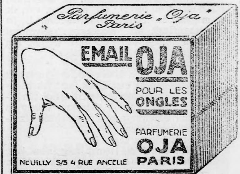
Valódi Email OJA csakis eredeti dobozban kapható

Uj Megnyilt Robert Sturm Megnyilt Uj tüszér, csemege és cukorkaüzlete. Cluj St. Regina Maria 36. legolcsóbb bevá- árási forras. Specialis csemege-különlegességek.