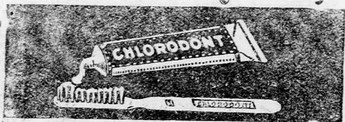
Chlorodont fogpaszta, Chlorodont fogpor, Chlorodont szájvízkivonat

— Hogy Palesztina ma már a politikai és gazdasági faktorok sorába lépett, bizonyosság erre az is, hogy ugy Franciaország, mint Németország külügy miniszteremunk úján Pro Palesztina tars ssegokat alkítottak azzal a rendelkezéssel, hogy Palesztinával gazdasági relációkat teremtsenek. Amikor tehát