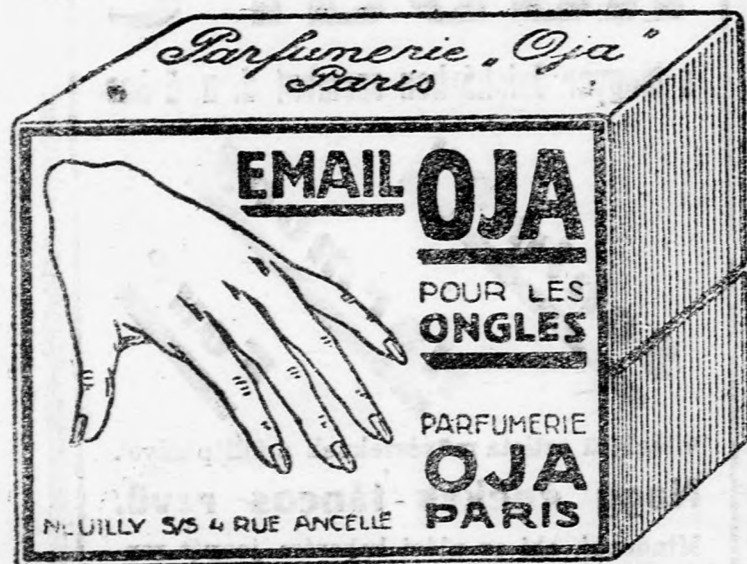
Valódi EmailOJA csakis eredeti dobozban kapható

Clare legyöngyülve az első nagy hajszá iramaiban, Malise-szel kísérli meg rendezhözni az életét. S meg is valószínű, ha ennek ugyan-osa nem volna ára. Az angol válási törvény ugyanis a csábított horribilis kártérítésre köte-