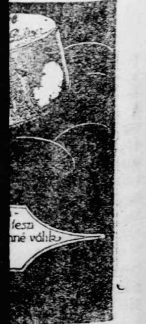
tesz né vidék.