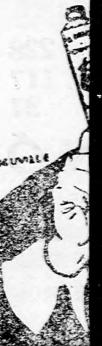
A világ B. Lax, F

landó a ma nára reduk járulnak eg irodához. mindenekel Ezzel kapc indítása el lekötött tét is. A leng melést csőh üzembe t piacokra gy nikai nehé delegációk kubai javas nak a piac terminárok