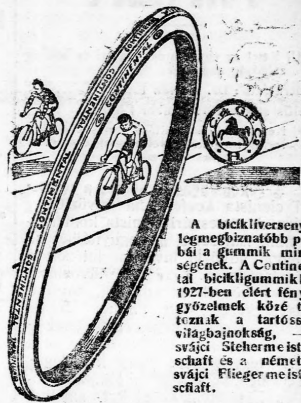
A bicikliversenyek legmegbízhatóbb próbái a gummik minőségének. A Continental bicikligummiakal 1927-ben elért fényes győzelmek közé tartoznak a tartósági világbajnokság, — a svájci Stehermeister-schaft és a német és svájci Fliegermeister-schaft.

Ez az indítvány nagy derűtséget keltett, mert hiszen a szász tartománygyűlés jelenleg alig egy hete működik. Az elnökség szavazás alá boesította a kommunisták furcsa követelését, amelyet a tartománygyűlés nagy többsége természetesen elutasított.