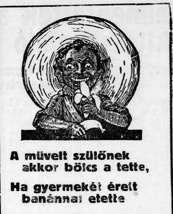
A művelt szülőnek akkor böics a tette, Ha gyermekét éreit banánnal etette

Később Löwenstein a megvásárolt rész- vénytömeget adta, mégpedig valószínű- leg ellenségeinek. Akkoriban általában az