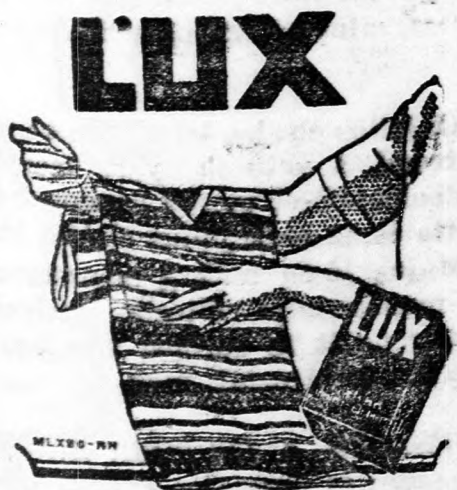
LUX-ot nem lehet kapni seholsem kimérve, hanem csakis eredeti csomagolásban.

Ára mindemütt: Nagy doboz Lei 30.— Kis doboz Lei 15.—