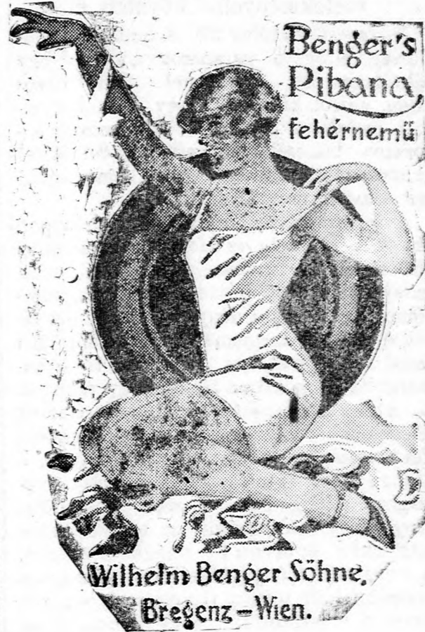
Kapható minden jobb detallüzletben

sége lelkesen ünnepelte a nagy feltalálót. Newyork, október 22. A detroiti Edison-ünnepségeknek külön érdekessége volt, hogy a nagy feltaláló részére olyan vasuti szerelvényt állítottak össze, amilyenben ötven év előtt közlekedtek Amerikában. Edisont az amerikai pénzarisztokrácia több vezető képviselője kísérte Detroitba. Az