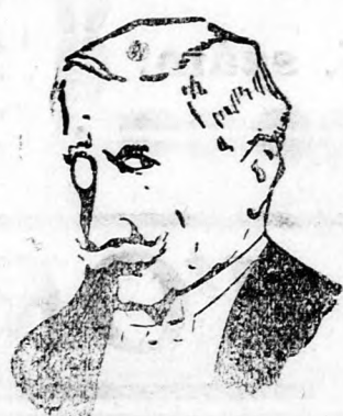
Az embert barátjáról...