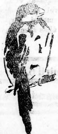
A madarat a tolláról...