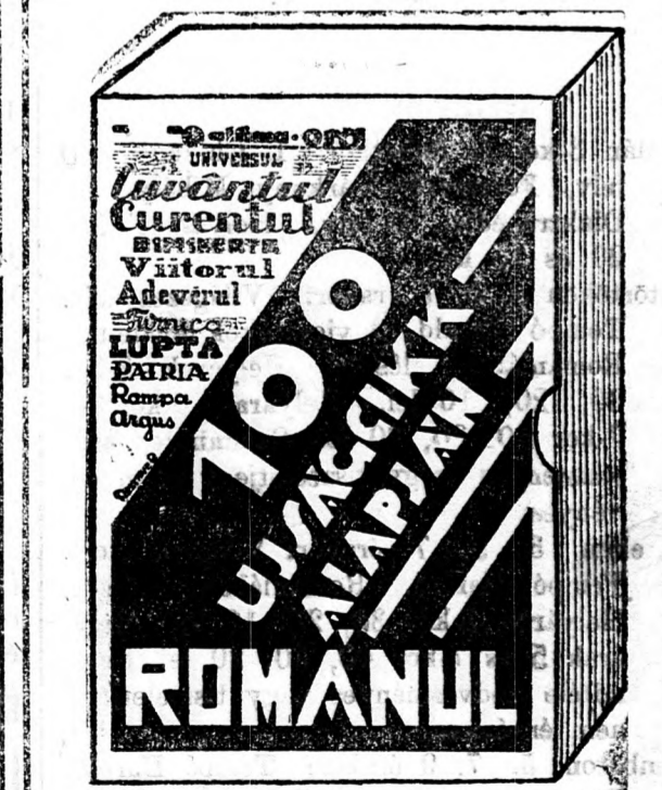
CHRESTESIU-DERI: ROMANUL 100 UJ SZAVAKKAL ALAPJAN

és mégis a legalaposabban megtanul románul ebből a könyvből: