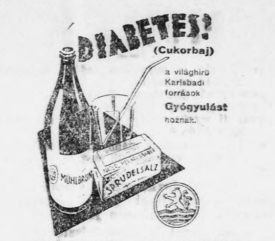
Még máma beszéljen orvosával a természetes Karsbadi Ásványvízzel és eredeti Karsbadi Sprudeláccal tartandó Mézükuróról.

területéről. A rendőrség több vidéki városban is házkutatásokat és letartóztatásokat eszközölt.