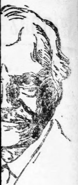
Lord Balfour nagy barátjának.

Mindenki, aki résztvett a nagyjelentőségű összeövetelen, azzal a meggyőződéssel távozott, hogy többé semmiféle hatalom meg nem gátolhatja az egymásra talált nagyromániai zsidók egyesülését és hogy a jövőben minden támadás, amely a romániai zsidóságot éri fogja, az egyesített romániai zsidóság védőfalába fog ütközni. Azt a keskeny rést, amelyet pozíciójukat feltű vezetőik erejük végső megfeszítésével próbáltak útni az egységes front védőfalán, ki fogja tölni a zsidó egység minden ellenállást leküzdő ereje.