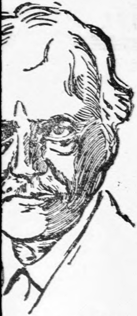
mléket Lord Balfour nagy barátjának