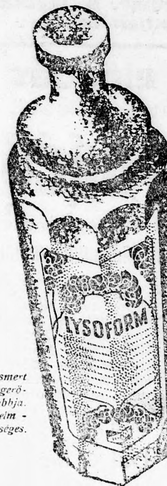
A Lysoform az ismert fertőtlenítőszer-k legerősebbje és legbiztosabbja. Minden otthonban elmaradhatatlanul szükséges.

Számos zavaró kellemetlen organikus női bajnak az a téves hit a forrása, hogy szappan és víz elegendőek a mindennapi „intim toalett”-hez. A Lysoform használatával a legbiztosabb elkerüli minden ilyen eredetű zavarnak.