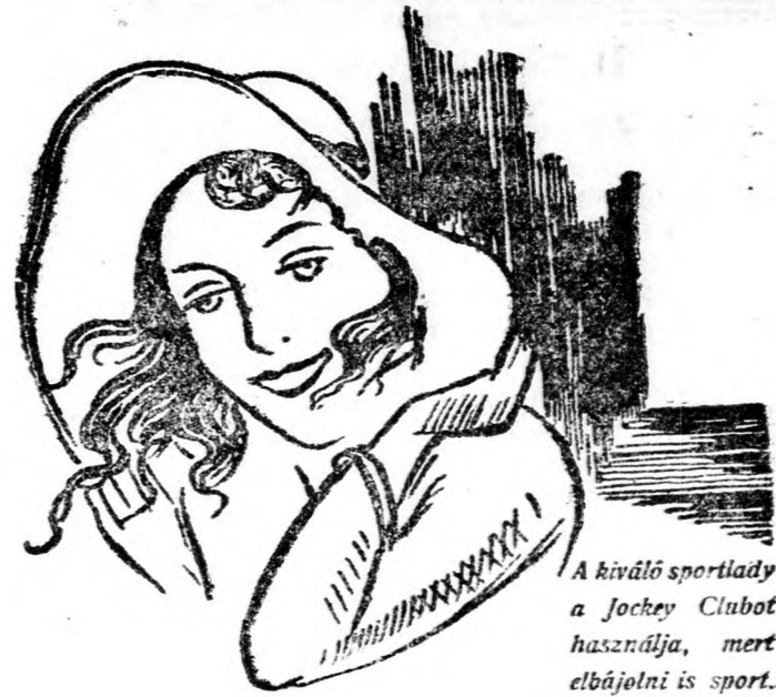
A kiváló sportlady a Jockey Clubot használja, mert elbájosítja is sport.

A Jockey Club kölnivíz energikus és tisztá illata azt a sportkedvelő előkelő világ kedvencévé tette