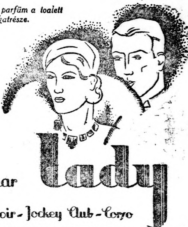
E bódító parfüm a toalett fontos alkotrésze.

Mint a Lady minden parfümjét, a Rouge et Noirt in a szépség hírneves specialistái készítették az abszolút tiszta alkotászekkből. Ez a híres márkájú kölnivíz az elegáns nők parfümje, mert erősíti a bőrt és a legkényesebb epidermiszt is frissé és bársonyossá teszi.