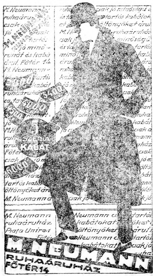
M. NEUMANN RUHAÁRUHÁZ FÖTÉR 14

BARHOL MEGJELENT KÖNYVEK MEGKAPHAT AZ UJ KELEBT KÖNYVOSZTÁLYBAN.