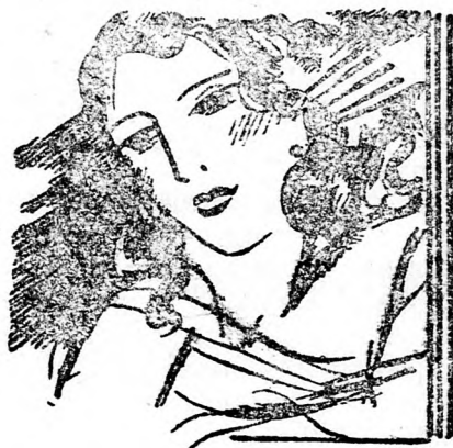
Légis és finom illata, — a Perle de Paris hódolat a női báj előtt.

a Perle de Paris illata a jóízű hölgyhöz szól