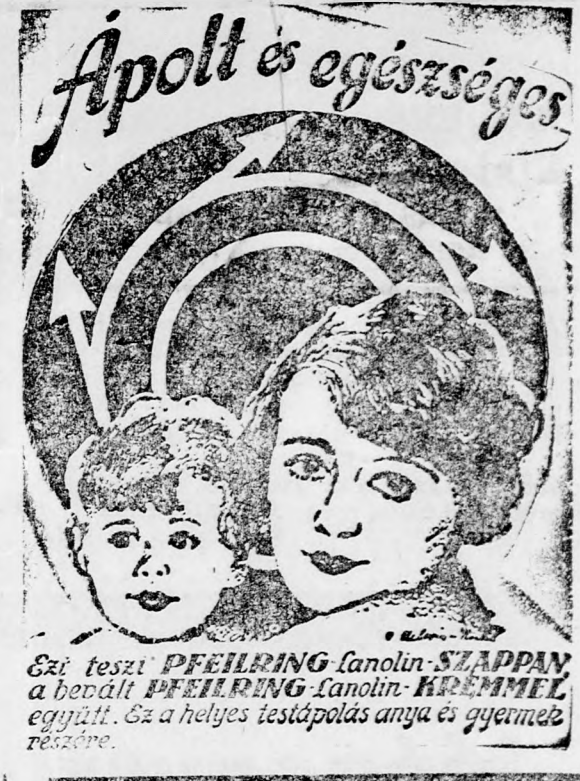
Ezt teszi PFEILRING Lanolin-SZAPPAN a bevált PFEILRING Lanolin-KRÉMEL együtt. Ez a helyes testápolás anyja és gyermeke részére.

Kisanyád mult év április elején elhagyott és azóta Te nélkülöd is, magányban remeteéletet élek, aki Téged imád, sok éj-