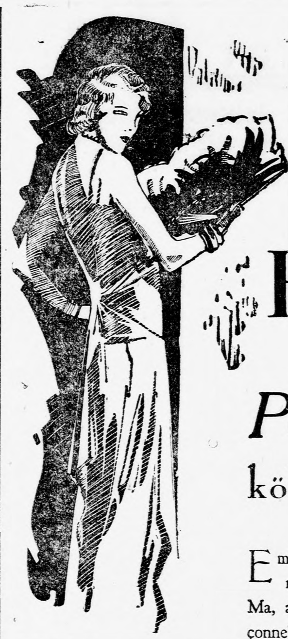
„Perle de Paris” nővel fiatal szökek báját...