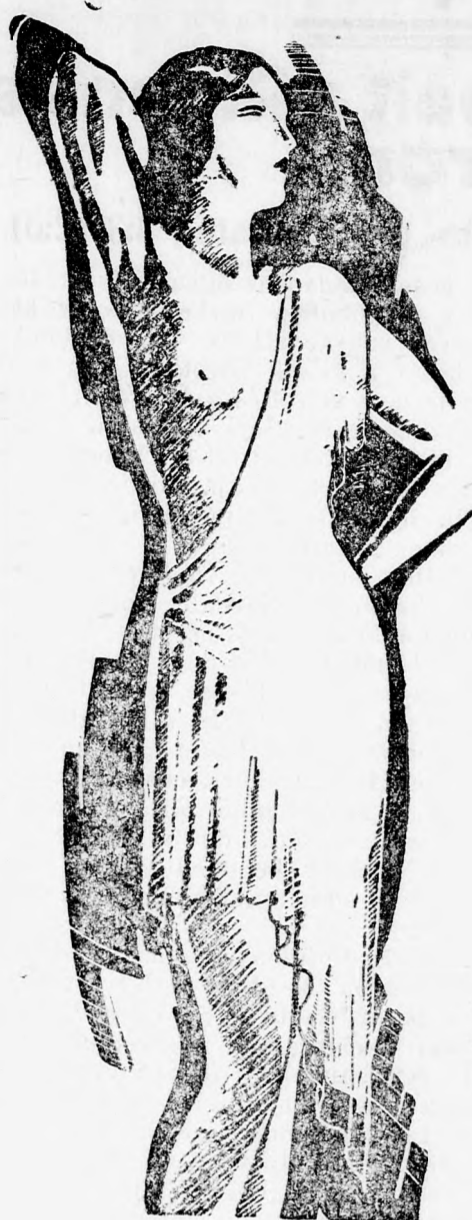
Fürdő után gyors bedör- zés az illatos „Pari- sienne” kölnivizzel.

A bizottság tagjai a legteljesebb megelégedésüket fejezték ki a kiváló világvárosi teljesítmény fölött.