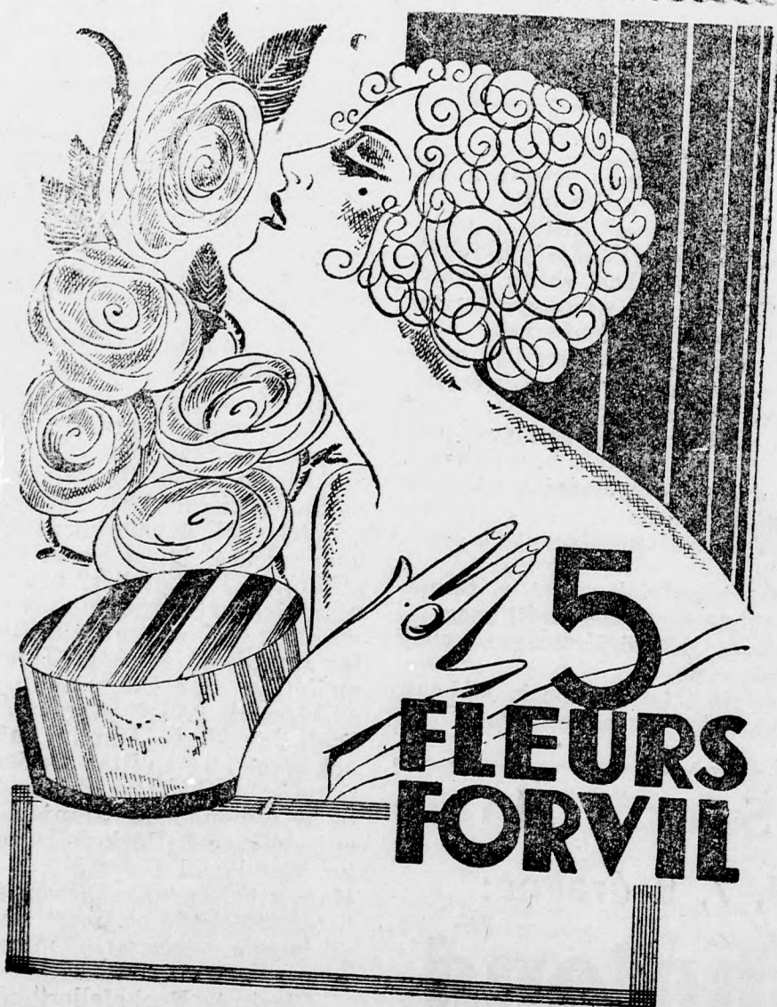
A legfinomabb puder

Cluj, Strada Universitatii (volt Egyetem uca) 1. (Szemben a Newyorkkal.) SELYEMHARISNYAKBAN NAGY VALASZTÉK!