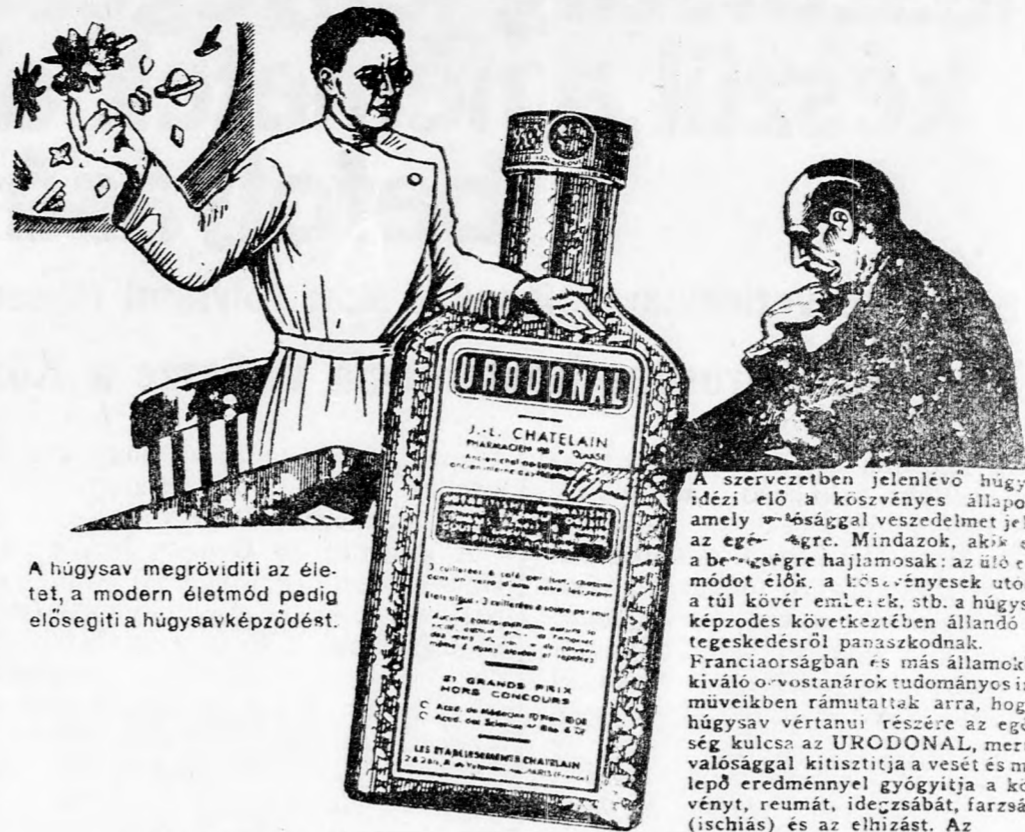
A húgysav megrövidíti az életet, a modern életmód pedig elősegíti húgysavképződést.

A szervezetben jelenlévő húgysav idező elő a kósvényes állapotot, amely a húgysav hajlamosságát jelent az egész szervezetben. Mindazok, akik erre a betegségre hajlamosak: az idő előtérők, a kósvényesek utódai, a túl kőver emlékek, stb. a húgysavképződés következtében állandó betegkedésről panaszkodnak. Franciaországban és más államokban kiváló orvosok tudományos irás-műveikben rámutattak arra, hogy a húgysav vértanú részére az egész szervezet kulcsa az URODONAL, mert ez valósággal kizárja a vesét és meglévő eredménnyel gyógyítja a kósvényt, reumát, idegzsábat, farzsábat (ischias) és az elhízást. Az