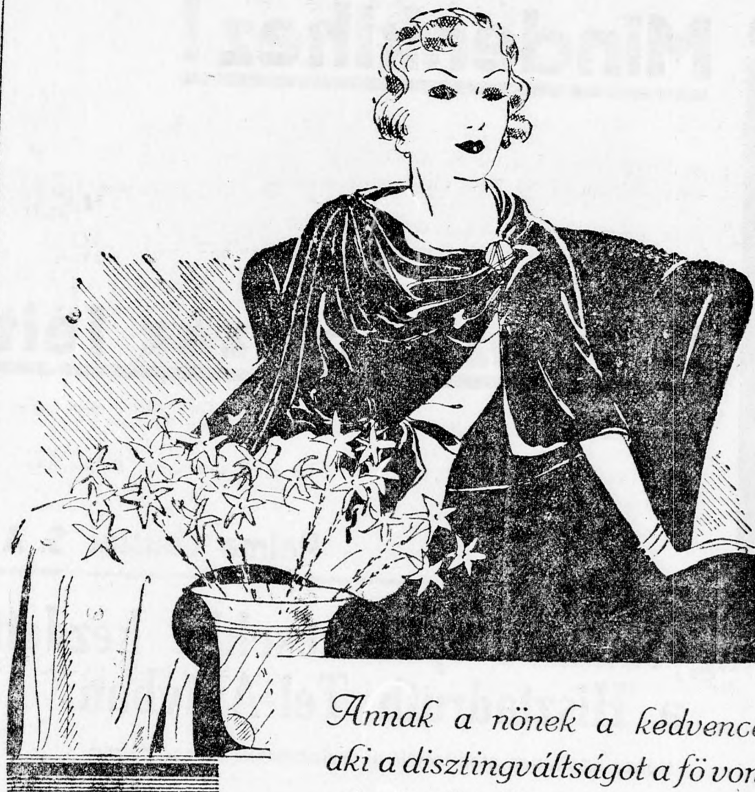
Annak a nőnek a kedvence, aki a disztinváltságot a fő vonzóerőnek tekinti.

A Petit Parisien egymás mellett közli az eredeti német és a francia szöveget.