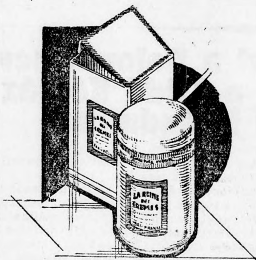
La Reine des Crèmes

Kiadó 2 és 3 szobás komfortos parkettes uccaj lakás, Mihai Viteazul 17.