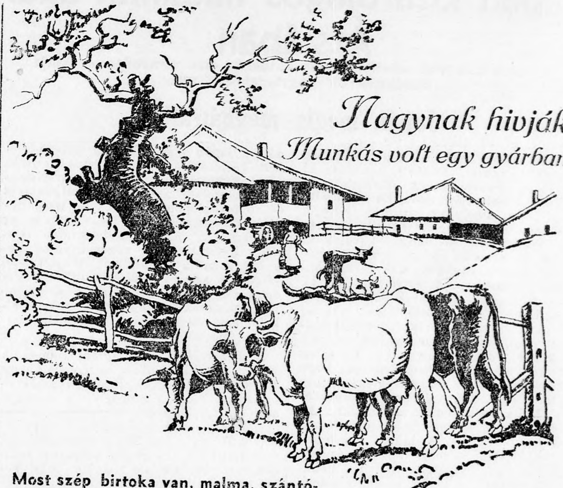
Most szép birtoka van, malma, szántó-földjei és legelője a marhák számára.

Jeruzsálem, április 24. Hivatalos kimutatás szerint 60.000 zsidó munkás van ma Palesztinában. 1932-ben 40.000 volt a nyilvántartott zsidó munkások száma. A hatvanzer zsidó munkás közül 45.000 a Hészadruth Haovdim, az általános zsidó munkásszervezet tagja. Egyedül Tel-Avivban 20.000 munkás él, Jeruzsálemben 10.000. Ugyanennyi a Hajfában élő munkások száma is. A kimutatás szerint a palesztinai zsidó munkások 60 százaléka a városokban dolgozik. A mezőgazdasági kolóniákon dolgozó zsidó munkások számát 20 ezerre becsülik.