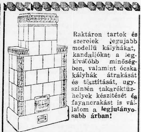
Raktáron tartok és szerelek legújabb modellű kályhákat, kandallókat a legkiválóbb minőségben, valamint ócska kályhák átrakását és tisztítását, ugyanígy takaréktűzhelyek készítését és fayanerakást is vállalom a legutányosabb árban!

Hölgyeim és uraim, tessék a színházba fáradni. Ezuttal nemcsak kacagni fognak, hanem meghatódni is. (sz. i.)