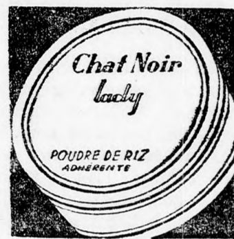
EGY DOBOZ 20 LEI

A legelső doboz is meggyőzi, hogy ennek a pudernak tapadóképesége, finomsága és tisztasága folytán az arcborre kiváló a hatása, az arcborreket azt a gyöngécs finomságot adja, amelyhez csak a rózsaszirmok és a természet többi csodás alkotása hasonlítható.