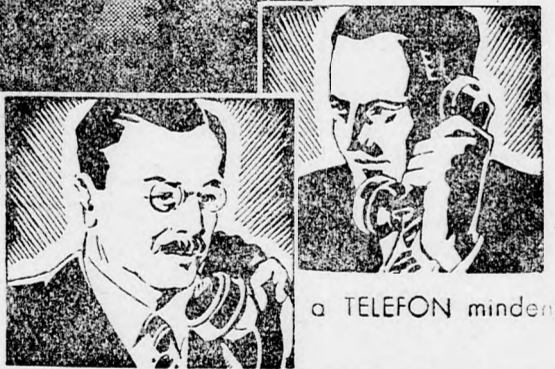
A TELEFON mindenre elkisérb.

— A kolozsvári Zsidó Nőegylet f. hó 9-én, csü örtök este 9 óraker rendezte első fagyaltestélyét a Cristal Palace d'ete (volt Florida) helyiségében. A jótékony cél érdekében kérjük tagjaink és az érdekelődők minél számosabb megjelenését az estélyre.