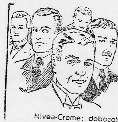
Nivea-Creme: dobozokban á Lei 16.—, 34.—, 72.—, tubusokban á Lei 30.—, 45.—

Kultiváljuk tehát magunkban a harcias erényeket — bátorságot, önfeláldozást, nemzeti idealizmust —, mert csak ezek fogják garantálni nekünk a valódi békét: a harcra kész nemzeti hatalmak egyensúlyának eredményeként és nem az általános gyávaságból, amelyet az összes népek parazitaikultiválnak, hogy kizsákmányolhassák őket.