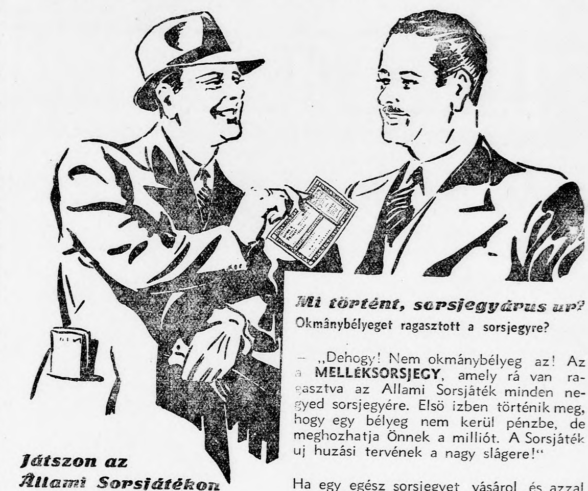
Mi történt, sorsjegyárus ur? Okmánybélyeget ragasztott a sorsjegyre?